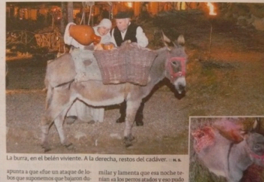
La burra, en el belén viviente. A la derecha, restos del cadáver. ... a. apunta a que fue un ataque de lobos que suprimen que bajaron de...

El ataque se produjo en una finca situada en las afueras del pueblo el viernes de madrugada