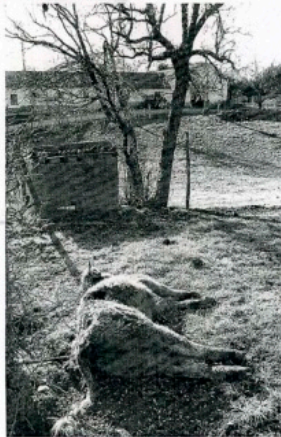
Una de las vacas que apareció muerta tras un ataque del lobo.